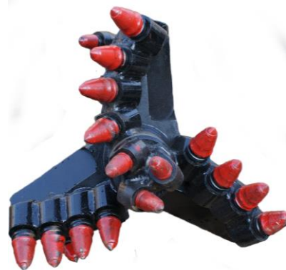
Głowica widiowa trzyramienna dla średnic od \varnothing 360 do \varnothing 1300