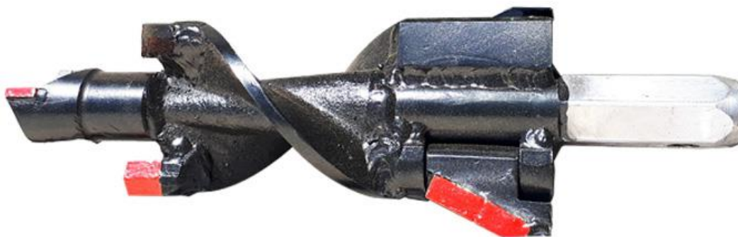
Głowica widiowa dla średnic \varnothing 90 , \varnothing 110 , \varnothing 130 , \varnothing 170 , \varnothing 230